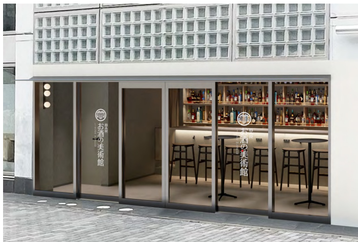
お酒の美術館 京都駅八条口店 店頭イメージ