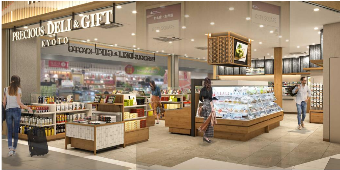
「PRECIOUS DELI & GIFT KYOTO」のイメージ

東海キヨスク(株)では、東京に次いで2店舗目となる「PRECIOUS DELI」店舗を ASTY SQUARE に開業します。「満月 阿闍梨餅」「出町ふたば 名代豆餅」など京都の人気土産に加え、地元有名店のお弁当や素材にこだわったおにぎり、人気のパンやデザートなど毎日ご利用いただける商品も充実させ高質な「食」にこだわったお店として、観光のお客様はもちろん、地元のお客様のニーズにもお応えしていきます。