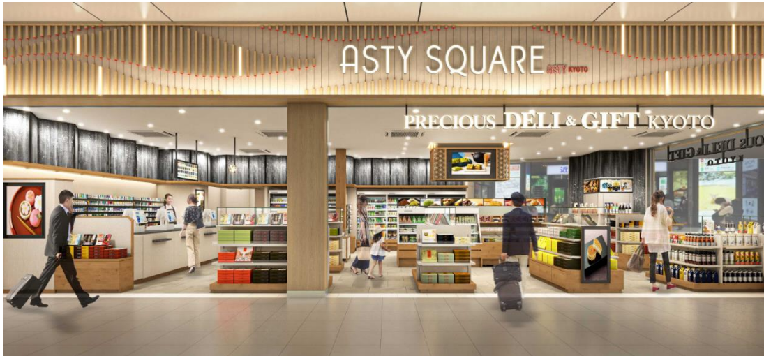
「PRECIOUS DELI & GIFT KYOTO」のイメージ